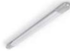
Luci a led