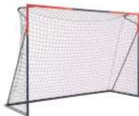
Porte da calcetto