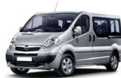
Furgone 9 posti